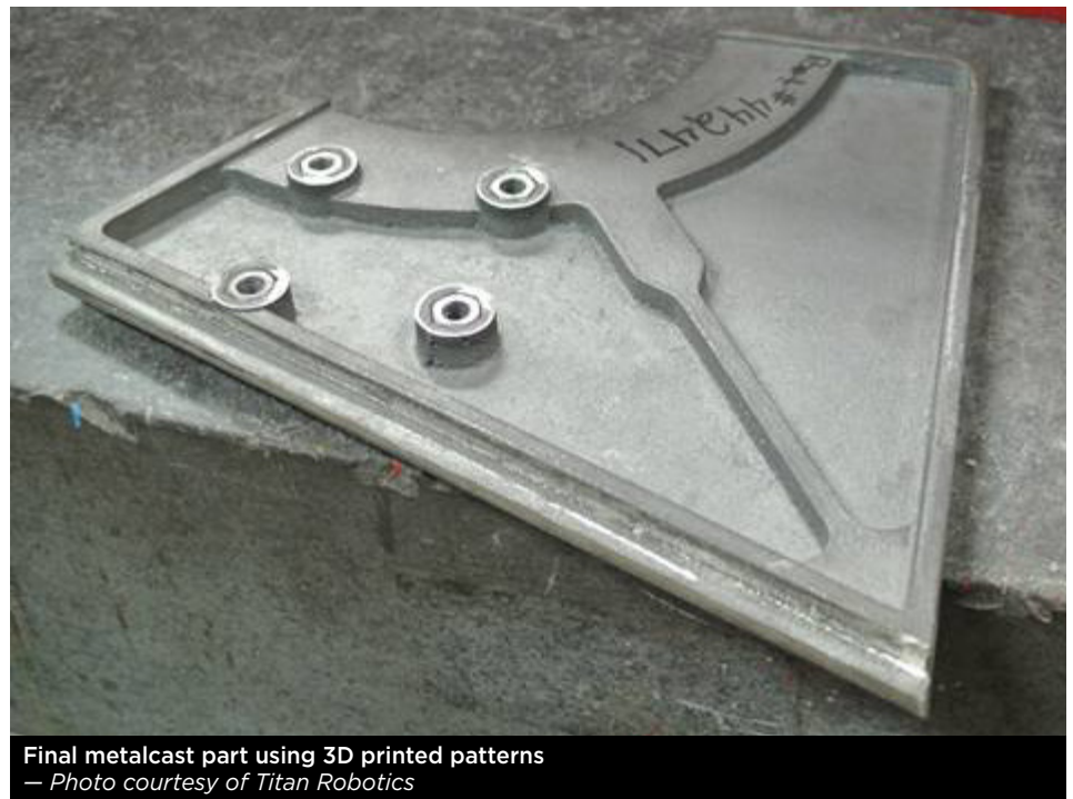
Final metalcast part using 3D printed patterns

Así como los fabricantes de impresoras de arena incrementan sus ganancias lanzando al mercado nuevas combinaciones de arenas y resinas, los fabricantes de